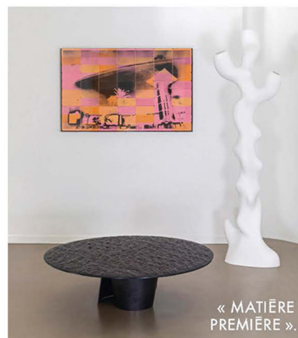
« MATIÈRE PREMIÈRE ».