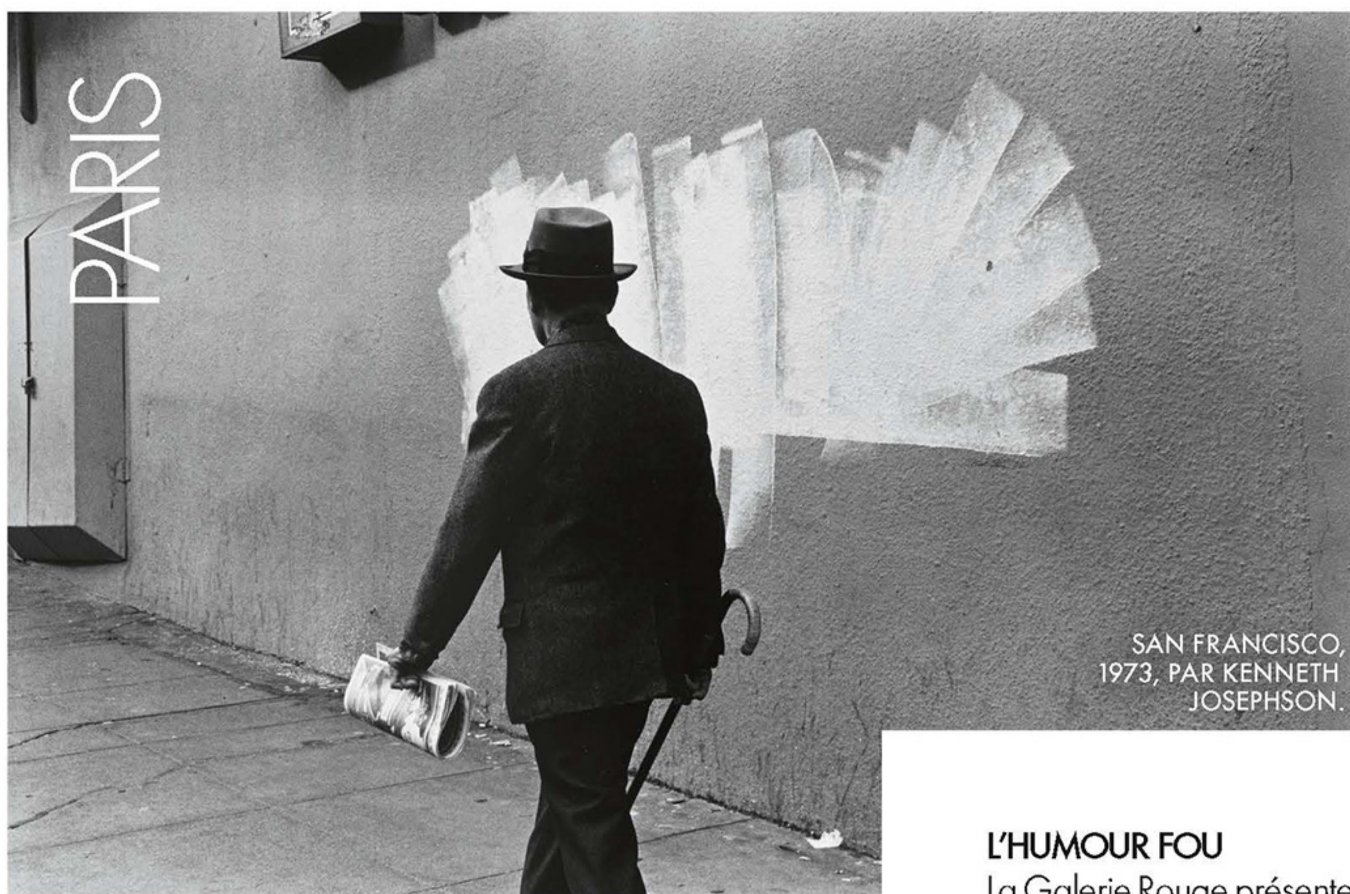
SAN FRANCISCO, 1973, PAR KENNETH JOSEPHSON.