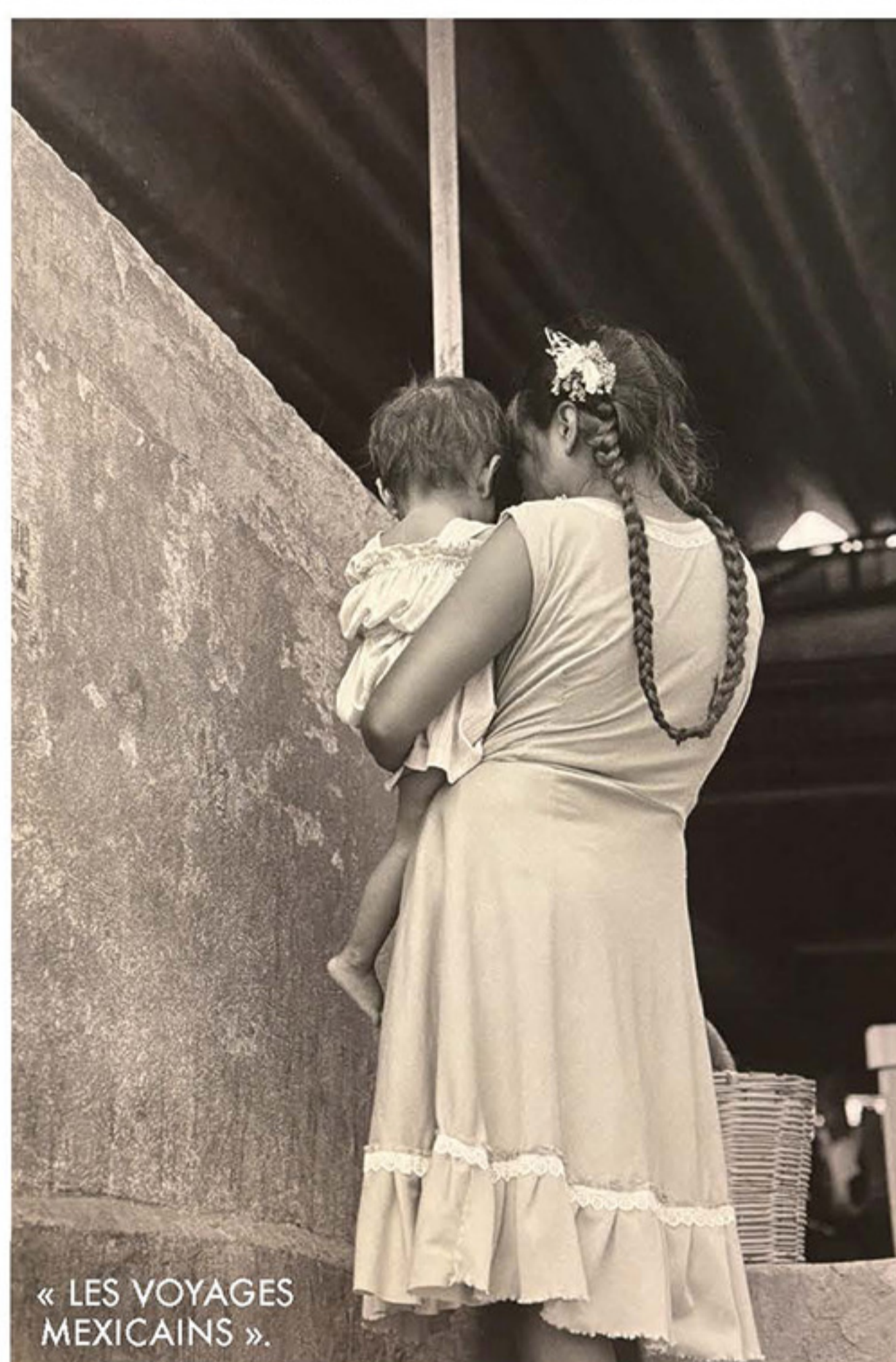
« LES VOYAGES MEXICAINS ».